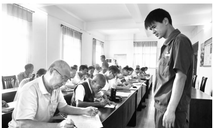
▲铜绿山矿9月2日开展退休职工“学政策、懂形势、知厂情”万人有奖答卷活动,大冶片区、下陆片区共计1200余名退休职工参加有奖答卷活动。

党中央、与上级组织保持思想上、政治上、行动上的高度一致;二是转变观念,适应反腐倡廉工作的新常态,要用新的形势、新的要求来待人处世;三是要跟着学、照着做,严于律己,发现问题及时提醒和纠正;四是要从思想上筑牢反腐倡廉的思想防线,做到防微杜渐;五是要落实“两个责任”,即党委的主体责任和纪委的监督责任;六是高度重视党风廉政建设和反腐倡廉工作,加强学习,提高修养,不断提高拒腐防变的能力。(胡小建)