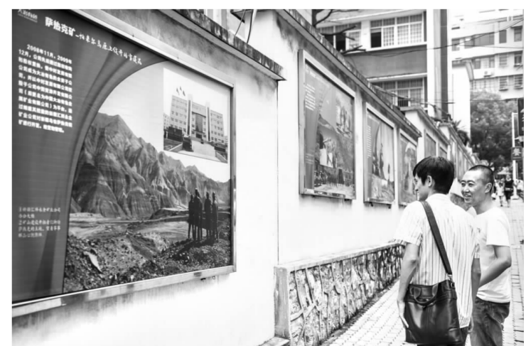
▲大冶有色新疆萨热克铜矿的建设备受职工和家属关注,企业文化中心以报刊、电视、宣传栏等多种形式对该建设项目进行大力宣传。这是文化长廊萨热克铜矿建设的图片展示,引来路人驻足观看。

质,更好的履行“一岗双责”,内保二大队组织该队的志愿消防队员开展了消防培训。此次培训共有85人参加,重点围绕志愿消防队员需掌握的“四懂四会”和“五个第一”内容展开。理论课培训结束后,队员们还现场学习了灭火器使用,进行了油盆灭火实战演练。