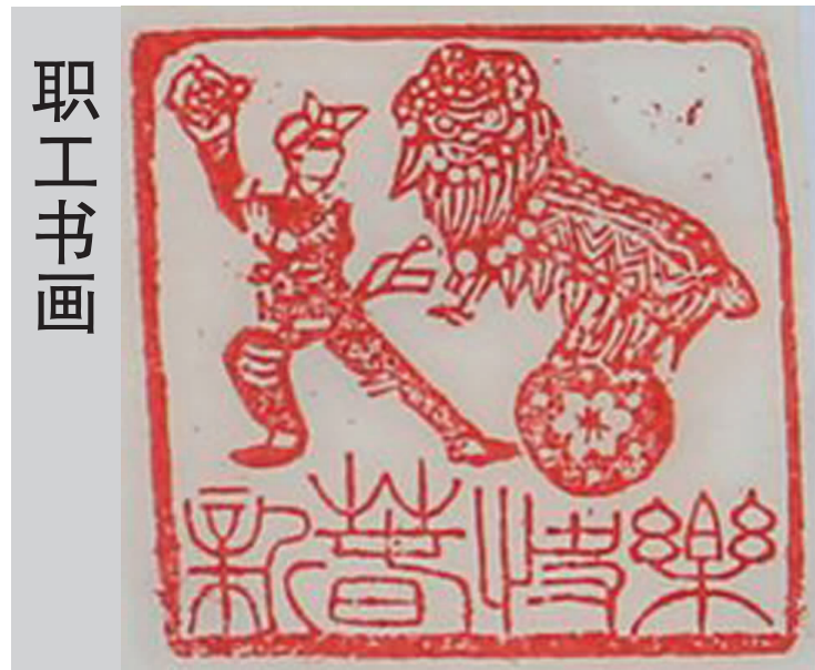
《新春快乐》(篆刻) 冶炼厂 张勇

2014年的钟声已经敲响,有色人鼓足干劲,大步走向新的征程。在这条迈向打造“五个有色”,早日实现有色梦的道路上,我们将以饱满的热情努力地工作,一起见证时代的变迁,工作的变迁,生活的变迁。让我们为有色的今天努力拼搏,为有色更加美好的明天努力奋斗吧!