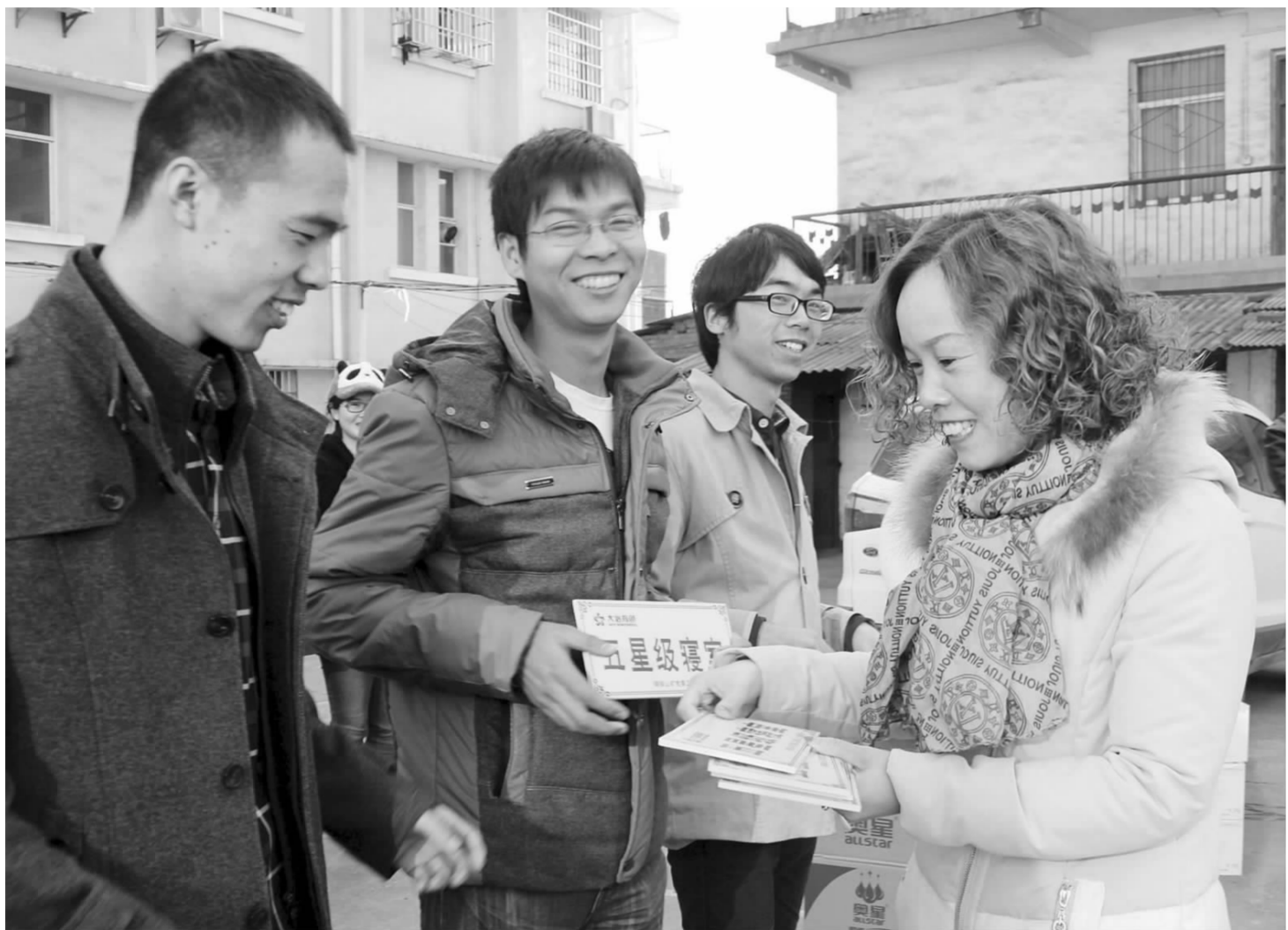
▲该矿工会相关负责人为获得“五星级寝室”的职工颁奖