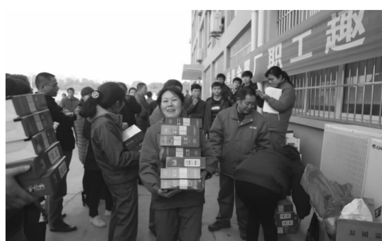
▲11月29日，稀贵金属厂在工业园区举办了职工趣味运动会，200多名职工参加了跳绳、拔河、踢毽子及乒乓球接力等四个项目的比赛。通过激烈角逐，硫酸镍车间、铂钯车间代表队分获团体一、二名。图为获胜代表队领奖。