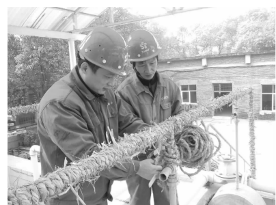
▲12月5日,动力分公司供水二车间综合班职工在生活一、二泵过滤池上给水管缠绕草绳,切实做好冬季供水防冻工作。