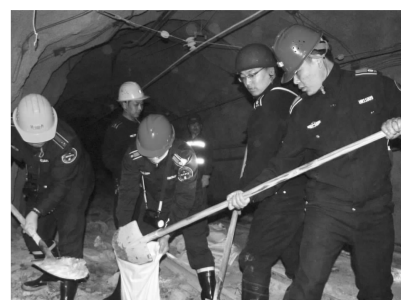
▲12月4日,丰山铜矿组织人员进行井下防洪抢险。经过三个多小时的奋战,使井下抽水恢复正常,避免了事故的发生。

检修改造两不误。该厂还利用检修前的停炉时间,开展了多项攻关工作。做到系统检修和工艺改造“两不误”。电炉冷修是本次检修工作的重中之重。电炉已使用三年,放铜口、放渣口耐火砖经过长期冲刷,导致铜水沉淀空间不足,铜渣不能较好分离,直接影响渣含铜指标。熔炼车间在电炉内加入钢球、生铁块,并用风管搅拌,对炉渣进行吹风处理,做好前期洗炉工作。停炉冷却后,职工再进入炉底清理炉结,扩充炉内空间。停炉期间,该厂将开展备料3号精矿库泵台修复工作,稳定给料速率,减少波动;为转炉50吨行车安装空气净化系统,改善行车作业环境;5号转炉143吨熔炉出口与烟道间伸缩节更换,防止漏烟;硫酸三系转化系统检修,提高转化效率。澳炉检修工艺升级,冶炼厂充分利用时间,合理安排人力,并力不停,一举两得。如今,冶炼厂澳炉尾期运行平稳,炉况正常,职工生产干劲足,岗位劳动氛围浓,按时完成全年产铜产量任务指日可待。全厂上下正齐心协力,奋力拼搏,即将从生产阶段过渡到检修阶段。(刘欣杰)