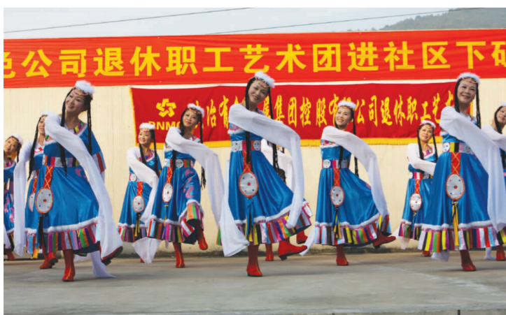
▲ 退休职工艺术团到矿山演出