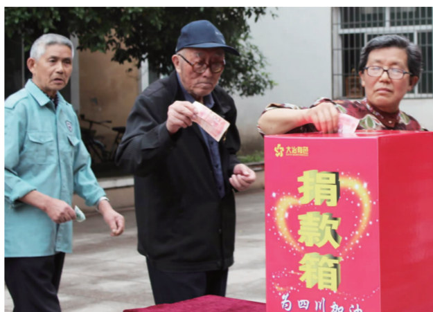
▲ 退休职工向四川雅安地震灾区捐款