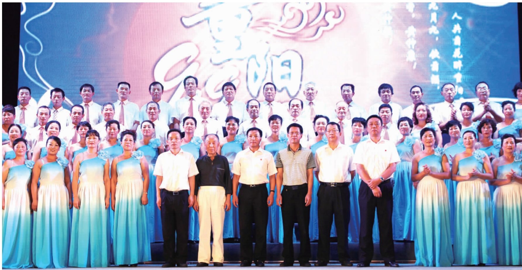
▲ 公司领导和嘉宾以及退休职工艺术团演员合影

公司现有1.7万余名退休职工。公司始终依靠职工群众办企业,积极践行党的群众路线,在加快企业发展的同时,坚持“大福利”理念,努力改善职工群众的工作生活条件,丰富退休职工精神文化生活。