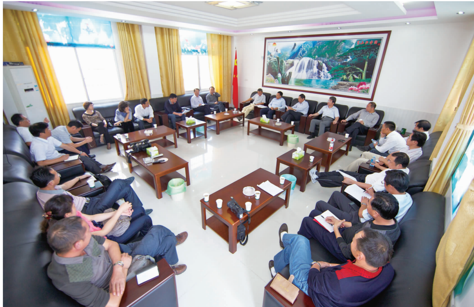
▼ 在梅川镇政府会议室召开的专题协调会。