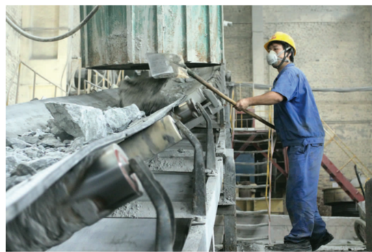
▲ 图为10月7日,铜山口矿选矿车间职工奋战在生产一线。