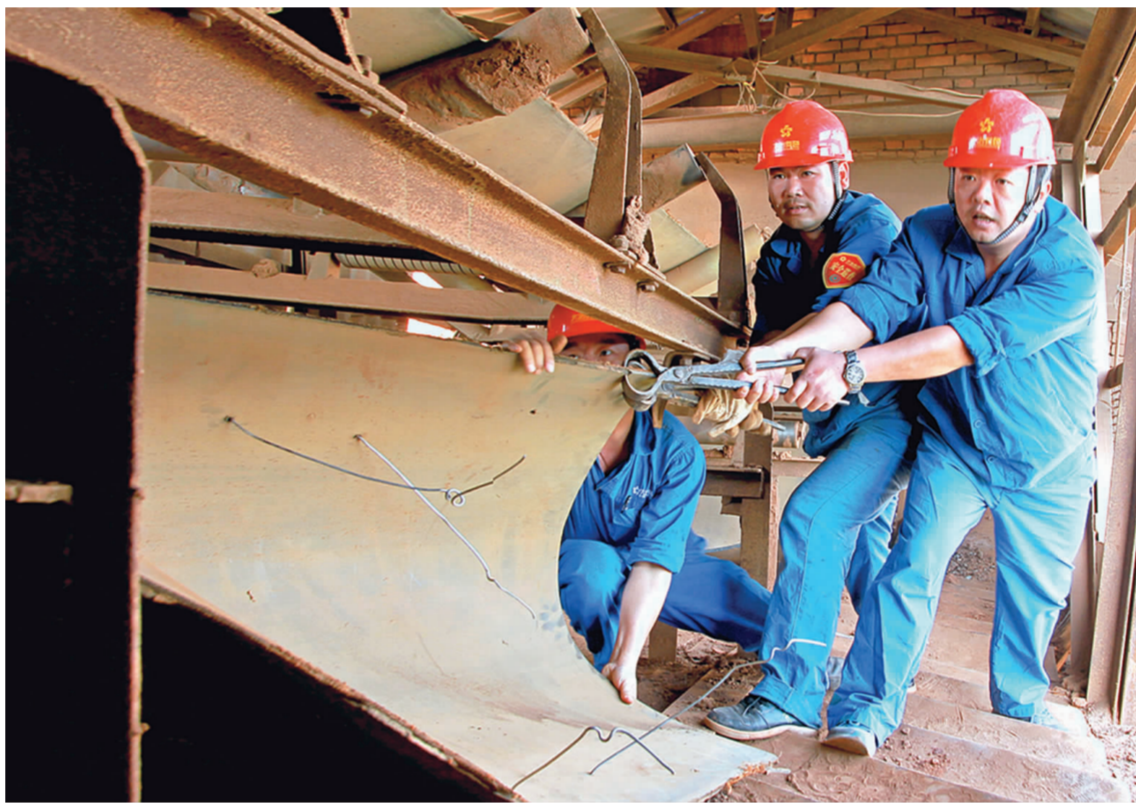
▲ 图为10月3日,铜绿山矿选矿车间碎矿工段职工在更换皮带。

该矿于9月26日就下发了国庆期间中层管理人员值班安排表,矿领导班子成员、一线生产单位以及各部室负责人与基层职工一起坚守岗位。采掘车间在安全生产形势严峻的条件下,加强采矿、供矿、充填、运矿、提矿等管理工作,努力确保各生产环节畅通;选矿车间及时根据供矿条件和矿源情况,坚持做好原矿性质预报,制定并落实可行的工序质量要求和标准,碎矿、磨浮、脱水大班积极配合,抓班产、保日产、促月产;水电车间认真做好节前的各项检查工作,确保节日期间正常供水、供电,同时加大用水用电的检查处罚力度,杜绝违法用水用电现象。其他各单位都积极配合,确保节日生产不松懈。该矿还在节前成立了安全督察组,为节日期间安全生产保驾护航,确保节日期间安全生产“两不误”。