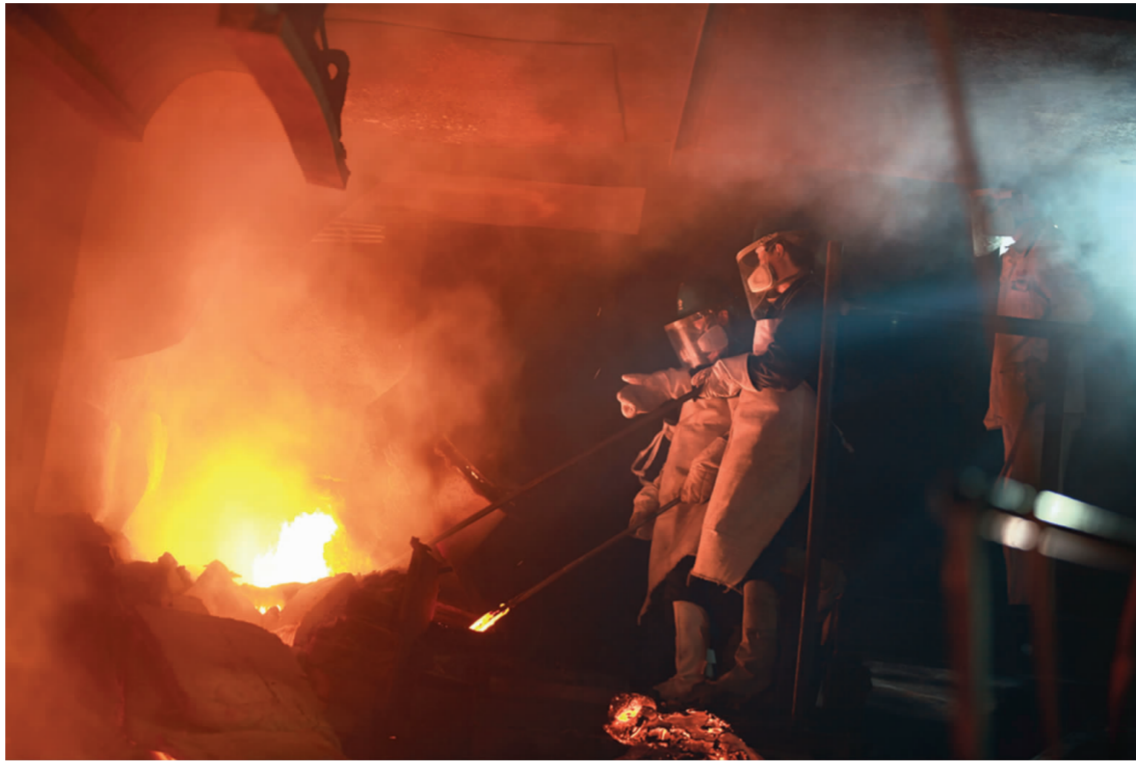
▲ 图为10月1日,冶炼厂熔炼车间职工在澳炉炉口清理炉渣时的火热情景。

该厂下半年紧紧围绕产量目标,在7、8、9三个月开展“战高温、夺高产、比贡献”劳动竞赛,职工劳动热情高涨。国庆期间,冶炼厂更是有条不紊,各项工作稳定有序,为完成全年目标打下了坚实基础。