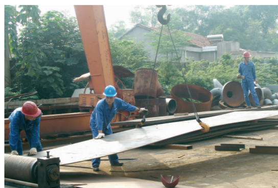
▲ 图为10月1日,聚鑫公司机电安装车间职工正在吊装钢板。