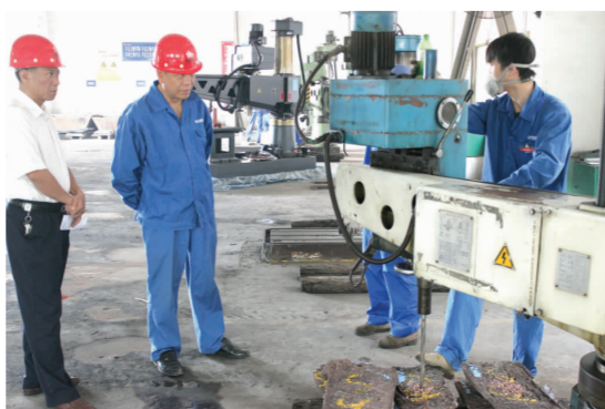
▲ 图为10月1日,质技中心有关人员对照铜钻样进行检查。

物流公司接到国庆期间水路6000吨硫酸发运的任务后,提前进行了部署,精心组织10辆危险品运输车辆与13只船舶联合发运。该公司面对人员少、运输任务重的压力,采取超常举措,变压力为动力,全力保质保量地完成水路硫酸运输任务。该公司相关负责人坚守厂区、码头现场,现场协调作业,做好安全防控工作。与此同时,该公司加强与相关工作人员的信息沟通,对硫酸运量进行估算,合理调配硫酸船只、车辆,并结合GPS定位,对船只、车辆的运行情况,进行全程监控,以此全力确保国庆期间硫酸高效运输。