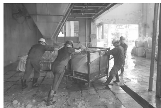
▲8月26日,稀贵厂硫酸镍车间组织20余名党员、入党积极分子对废液罐进行清理,通过4个多小时的艰苦劳动,从废液中共同回收硫酸镍50余吨。