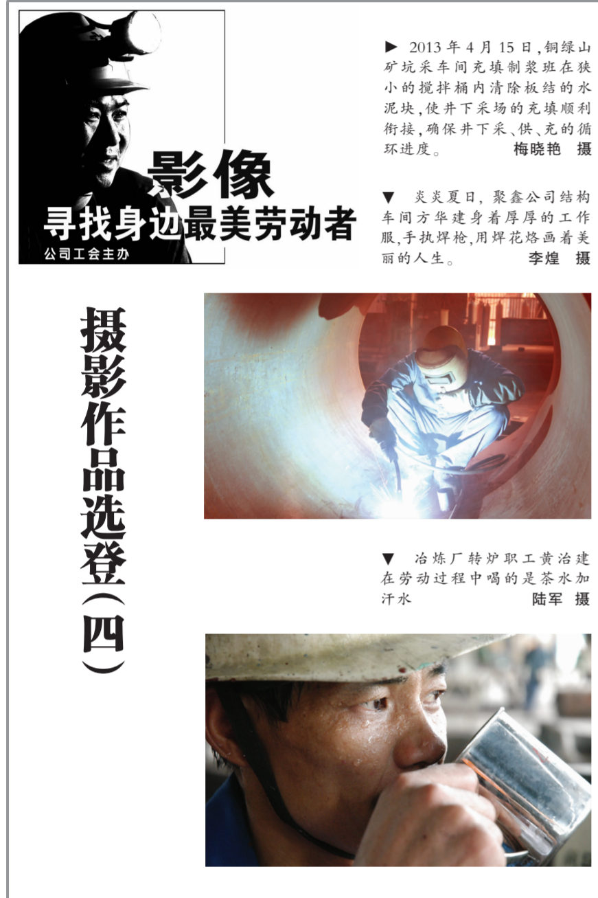
影像 寻找身边最美劳动者 公司工会主办

不管时代如何变迁,党员永远是一面旗帜。党员事迹充分说明了事业是实干出来的,任何心存坐享其成、好逸恶劳思想和做法的人是不可能干出一番事业的。求真务实、兢兢业业工作,就是我们学习党员的最好行动。弘扬党员精神,就要牢固树立“诚实做人,踏实做事”的人生态度,像我们身边的党员一样,从自己做起,从一点一滴做起,从平凡小事做起,以自身的实际行动,说真话,走正道,办实事,以自身的实际行动,投身到各自的岗位中,锐意进取,务实奉献,为实现有色人的千亿梦而努力奋斗。