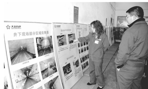
3月12日,铜绿山矿三友公司将全矿各二级单位好的成果改善、标准的SOP作业流程图及优秀问题票图片在各厂队来回展出,以提高员工素养。(罗峰峰 摄)

为了进一步强化职工宿舍管理,保障职工财产安全,铜山口矿生活公司组织该机关干部分别组织5人,本着厉行节约、控制成本的主导思想,自己动手,量尺寸、钻孔、订筛网、递工具,为单身宿舍楼一楼的26名住户安装了防护网。该矿近一年来,一直秉承着多为职工办实事、办好事的理念,从晾衣杆、热水器、电视信号安装等事情着手,切实服务职工生活,为职工创造良好的生活环境。