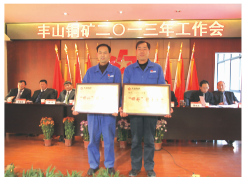
表彰2012年度矿基层“四好”领导班子

深入贯彻落实党的十八大精神和集团公司第一次党代会精神,坚持以科学发展统领全局,创新党建工作机制,融入生产经营中心,以实现“五化”矿山和“美丽”丰山为目标,以建设“四型”党组织为主线,以推进党建质量贯标和四好班子创建为抓手,增强发展内生动力,为实现全年各项工作目标提供坚强有力保证。