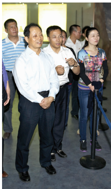
吴定富参观铜绿山古铜矿遗址