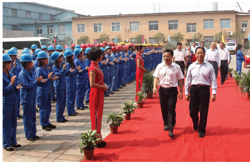
吴定富一行受到公司干部职工的热烈欢迎