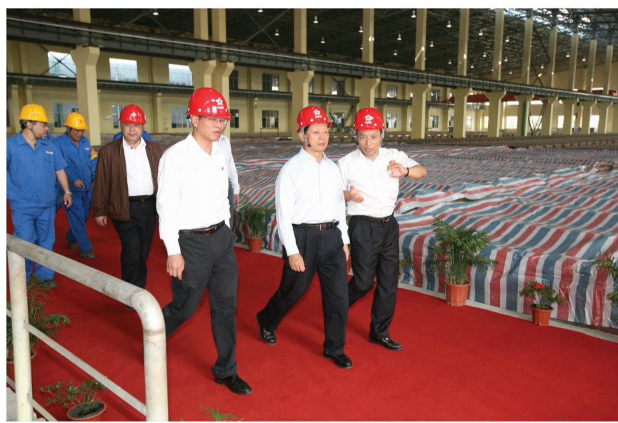
吴定富一行走进建设中的30万吨铜加工厂房