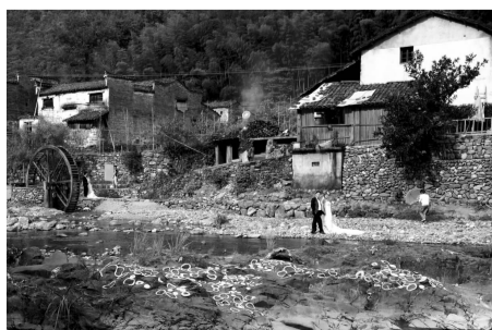
(结缘瑶里)

刚入初秋,天气透着一丝凉爽,放下手边的工作,离开城市的喧嚣与繁杂,我踏上了去江西瑶里的一场心灵之旅。