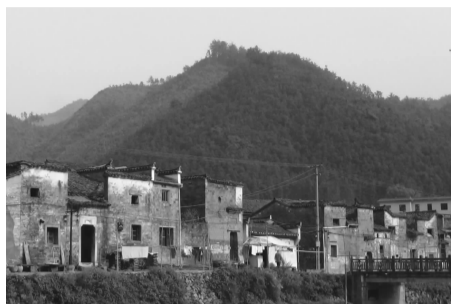
(古镇印象 龙卓越 摄)

喧嚣声和灯火辉煌的场景,把不少古老的、沉睡的古镇激活,而瑶里,却安静地躺在群山的怀抱,像熟睡的婴儿。