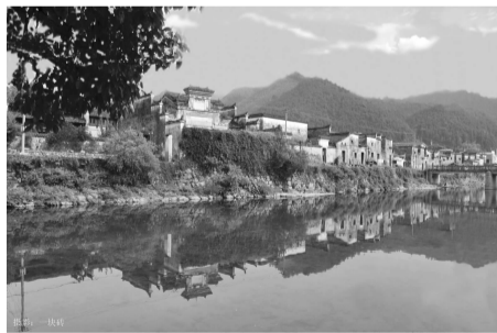
(山清水秀)

有人说瑶里的美,是一种生态美,难以用单一的美学概念加以描述。穿行于古镇的小道上,白云作霓裳,清风是伴奏,踏着时光的节拍,收集沿途的风景。在现在的旅途中,我们约定把希望放进行囊中,只是此刻的瑶里还只是刚刚落入秋的印象里,还来得及感受夏日的余温。