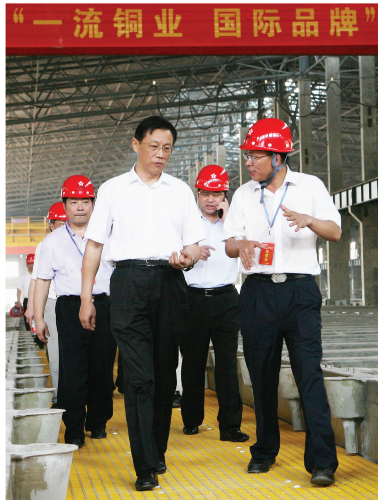
省政府资政段轮一视察 30万吨项目