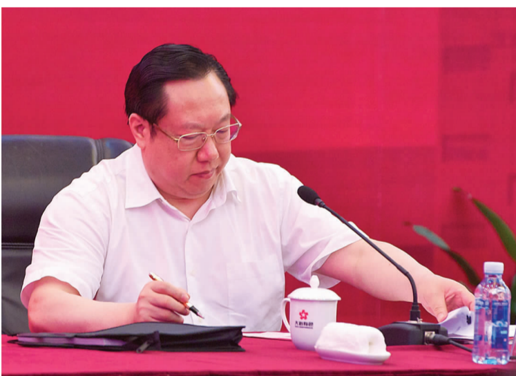
常务副省长王晓东