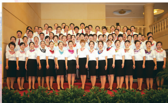
会场外的职工文艺小分队