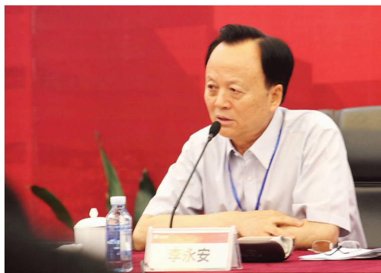
中国三峡总公司原总经理李永安