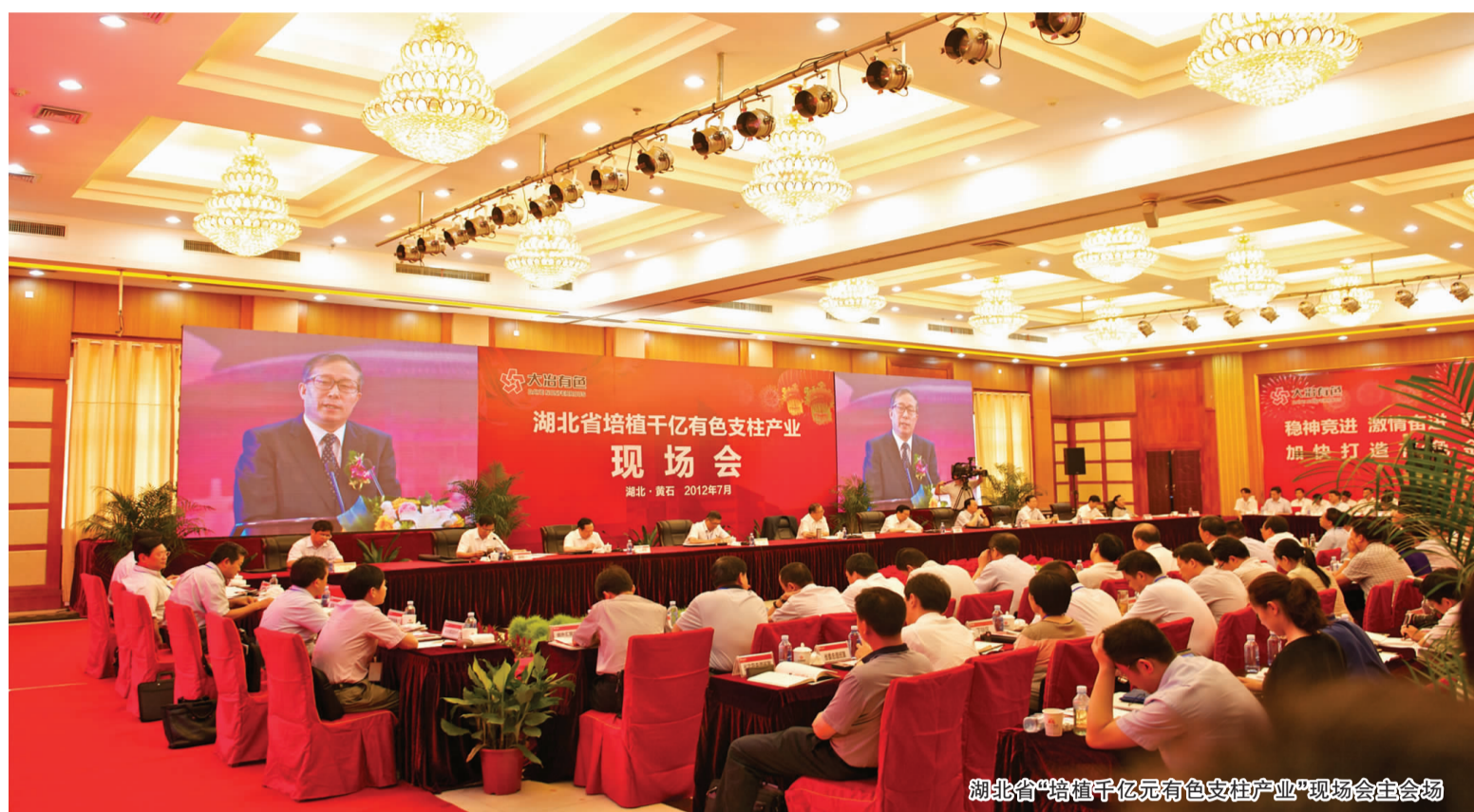
湖北省“培植千亿有色支柱产业”现场会主会场

省委书记李鸿忠:加快构建重要战略支点、实现富民强省目标,最终要靠产业支撑。加快产业发展,关键是要做大做强一批具有核心竞争力的工业企业。推动湖北省有色金属产业加速向千亿元产业迈进,重心是要支持大冶有色这样的龙头企业加快发展成为年销售收入过千亿元的企业。