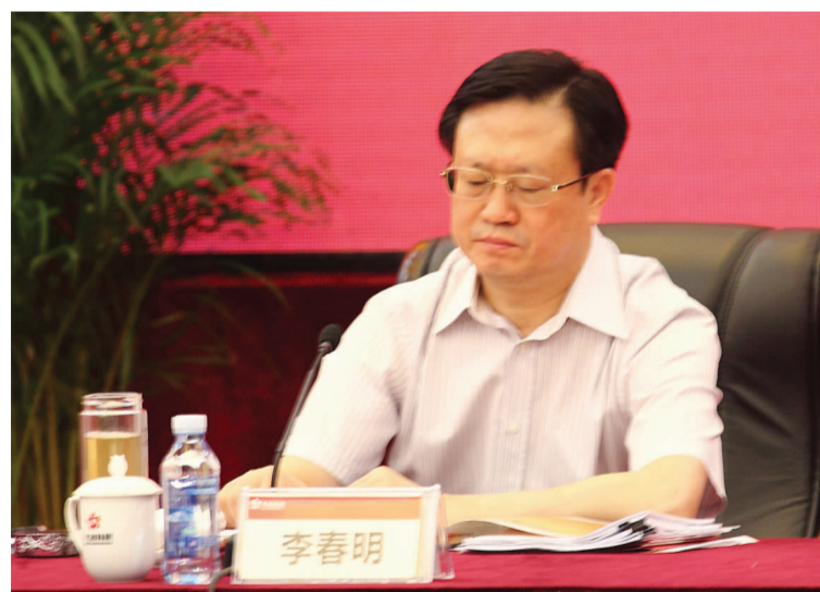
省委秘书长李春明