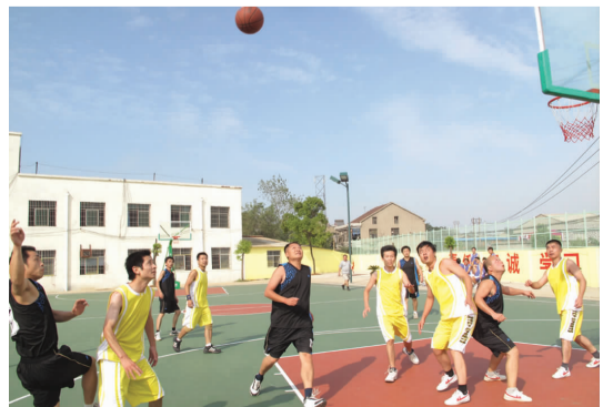
职工兴趣协会开展活动一览