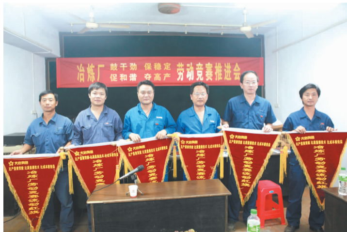
为劳动竞赛优胜单位颁发流动红旗

经济考核、职工岗位变动、生活福利、党建工作进行公开。班组每月对工资、存休、班费使用等情况进行公开,给职工一个明白,还干部一个清白。