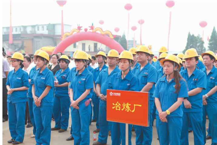
职工方阵参加大型活动