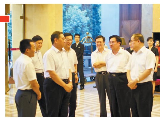
8月3日,湖北省委书记李鸿忠及湖北省省长王国生在武汉亲切会见罗海