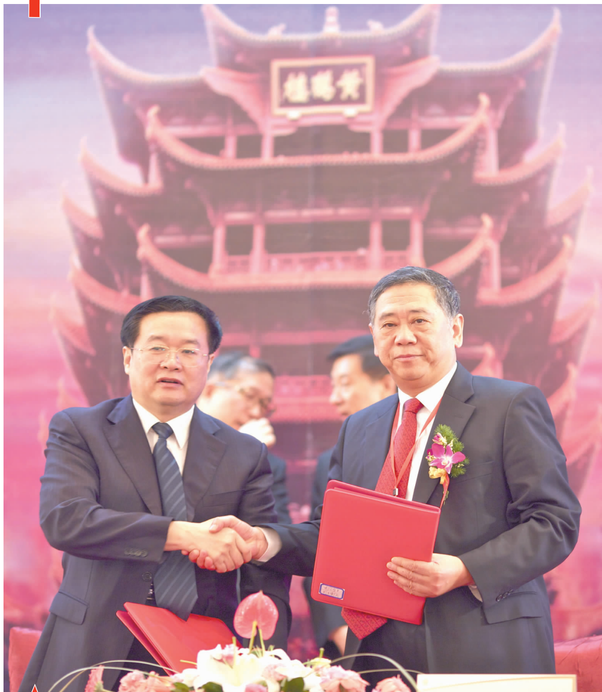
9月19日,湖北省与中国有色集团深化合作会议隆重举行