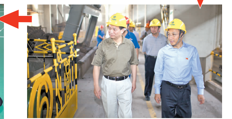
5月31日,湖北省委第四巡视组进驻公司,开展对大冶有色金属集团控股有限公司的巡视工作。