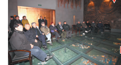
1月26日,退休干部参观澳炉