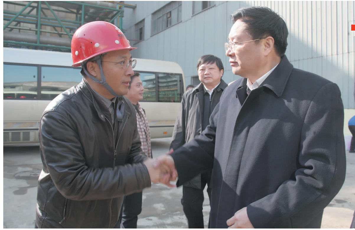
1月16日,湖北省省长王国生来公司视察。