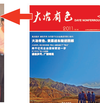
7月初,《大冶有色》杂志创刊