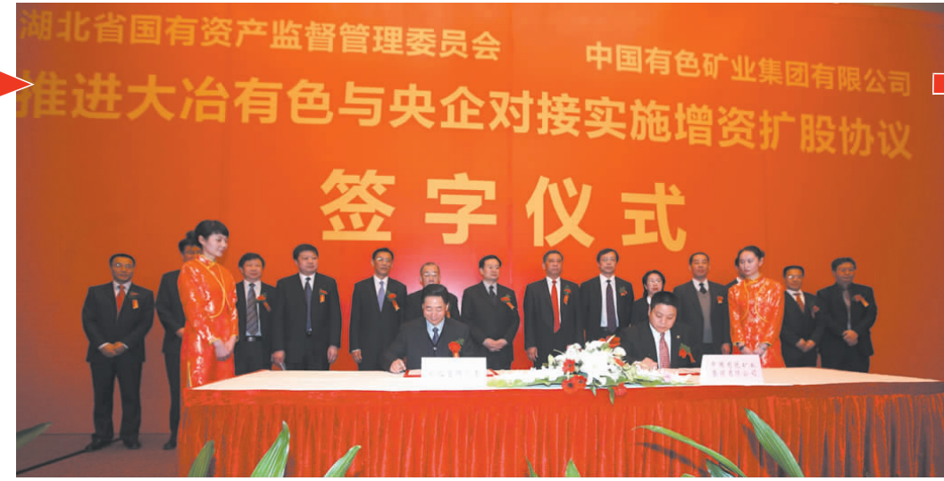
1月21日,中国有色集团与湖北省国资委签订战略合作协议