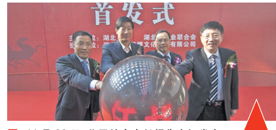
11月26日,公司社会责任报告在汉发布。