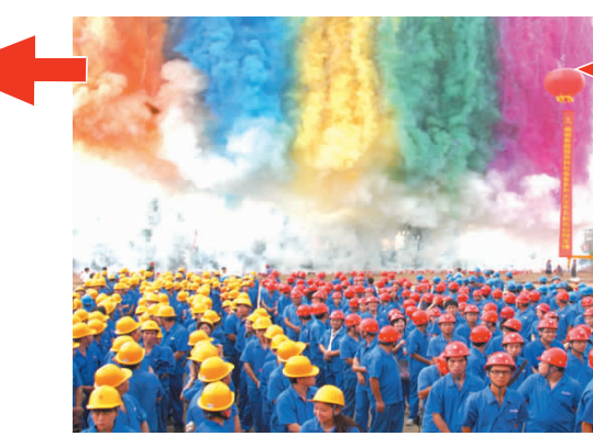
8月4日,公司30万吨铜加工清洁生产示范项目开工