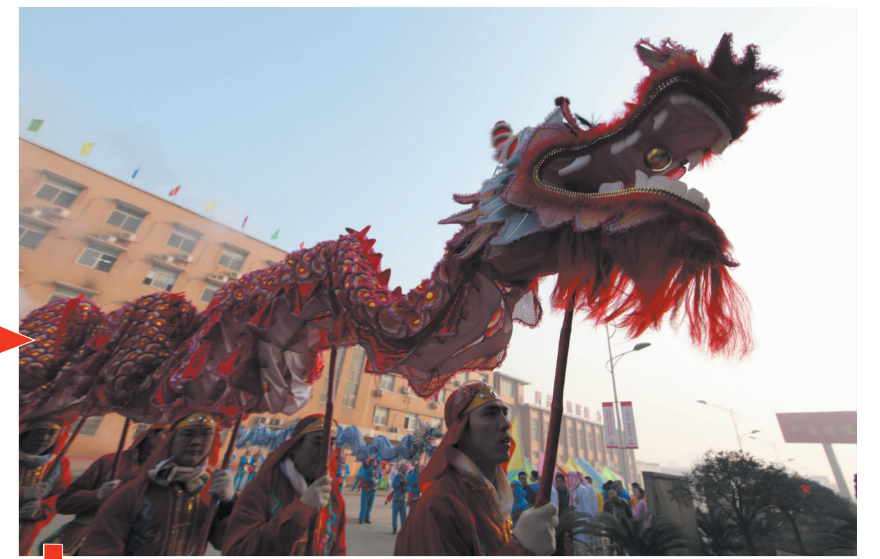
2月9日,龙腾虎跃闹铜都