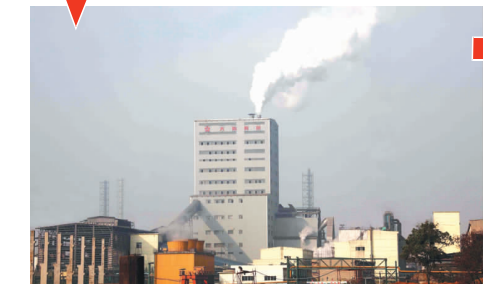
2月20日,澳炉竣工被评为省十大事件