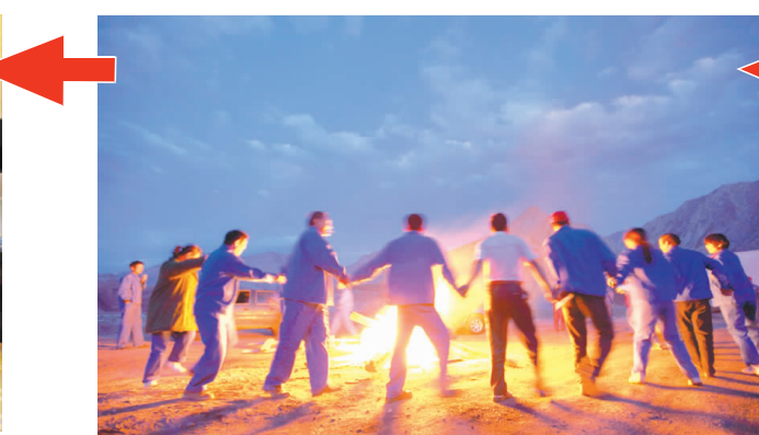
7月22日,公司部分职工代表走进新疆萨热克铜矿