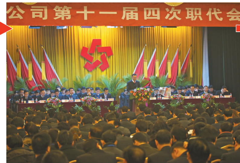
1月24日,公司第十一届四次职代会隆重召开