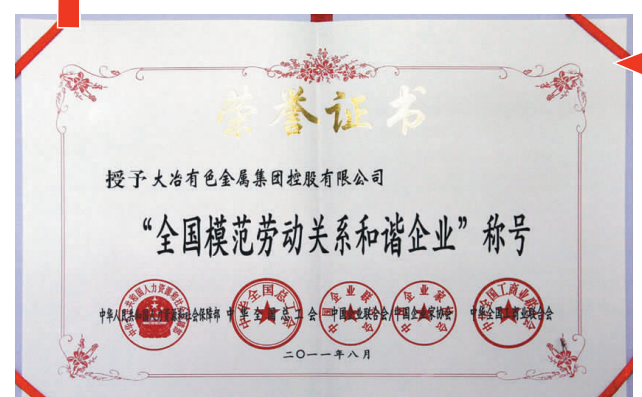
8月16日,公司被授予“全国模范劳动关系和谐企业”称号