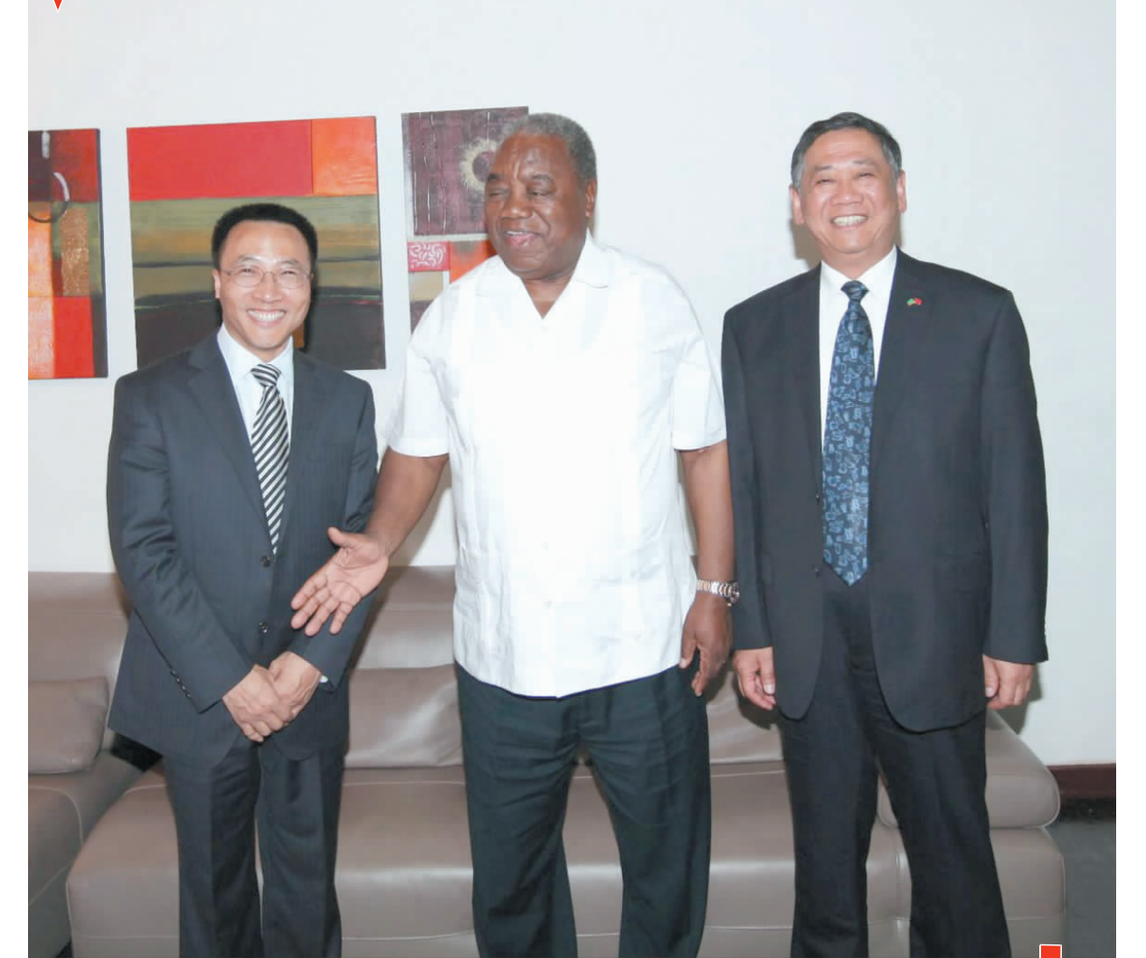
5月7日,张麟拜会赞比亚时任总统班达