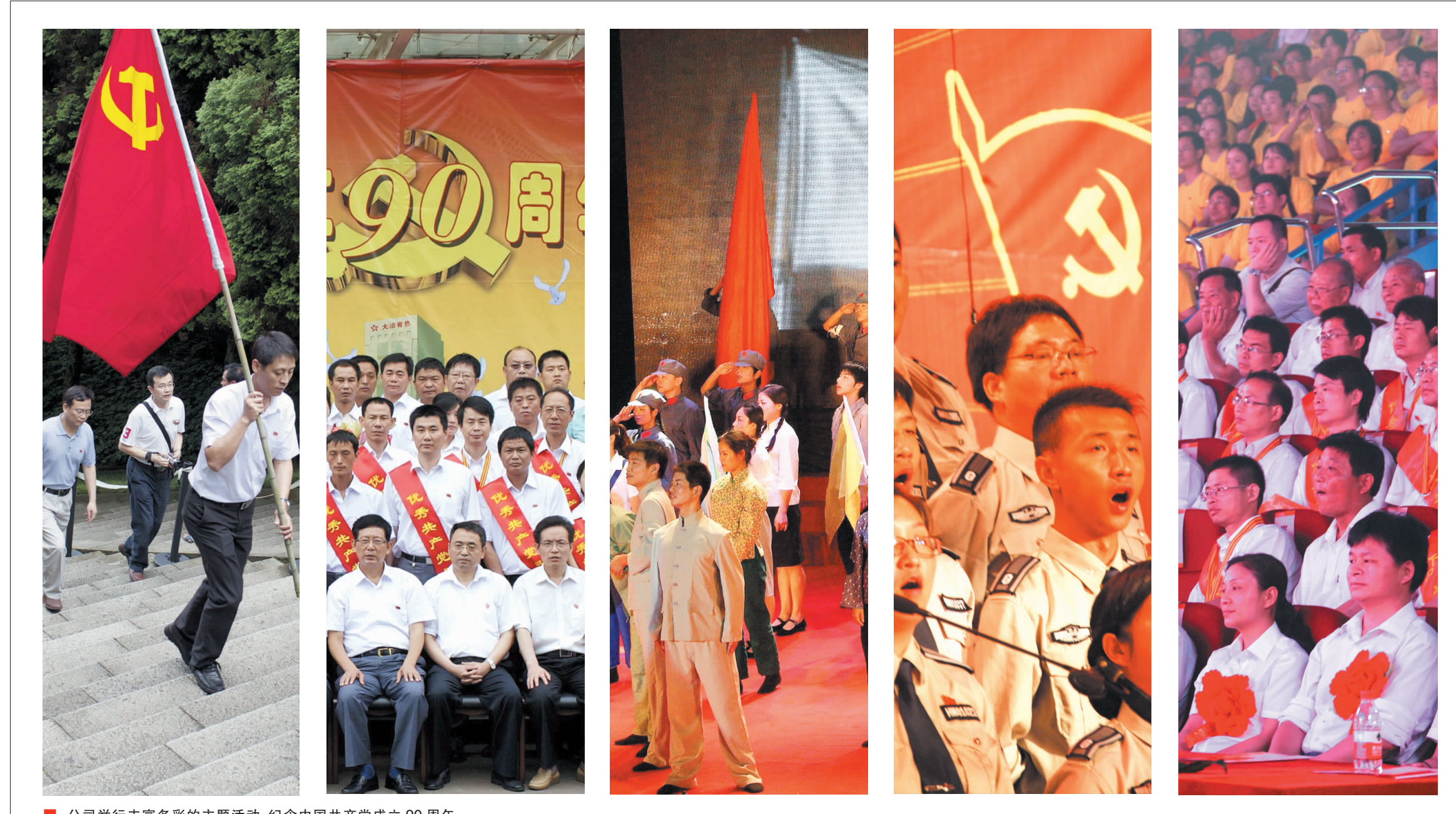
公司举行丰富多彩的主题活动,纪念中国共产党成立90周年