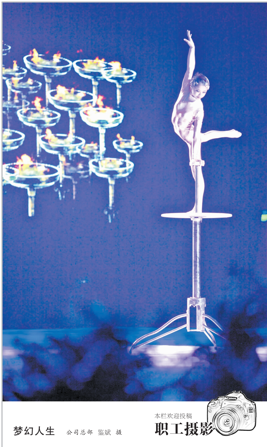
梦幻人生 公司总部 鉴斌 摄