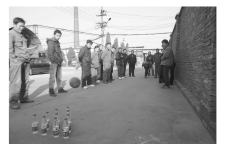
为丰富职工文体生活,12月13日,鑫诚铜业金永公司举办了一场职工趣味运动会。

据了解,今年元至11月份,矿工会各部门组织登门慰问生病住院、生活困难的退休职工823人次,救助困难职工270人,给38名困难学生发放了助学金,为44名重病人员办理了大病医疗救助,为17名病故职工申办抚恤费,发放救助金48万余元,发放节日费用27.46万元、节日物资40余吨,为1500余名退休人员做了工伤复查鉴定,发放医疗补贴,与企业 and 地方政府相关部门取得联系,为35名军转干人员妥善解决了退休薪酬待遇问题。