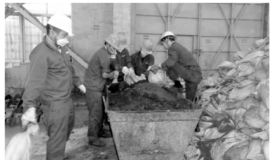
今年下半年,公司外购的阳机泥进入稀浆厂五车间焙烧班现场,该车间党支部针对处理量加大的情况,组织党员对现场的阳机泥进行突击转运。图为11月25日该车间党员在对阳机泥进行装袋的情景。

长期以来,鑫力井巷公司离退休职工队伍稳定,未发生一起群访、越级上访事件。退管工作为井巷公司的改革发展大局贡献了自己的一份力量。