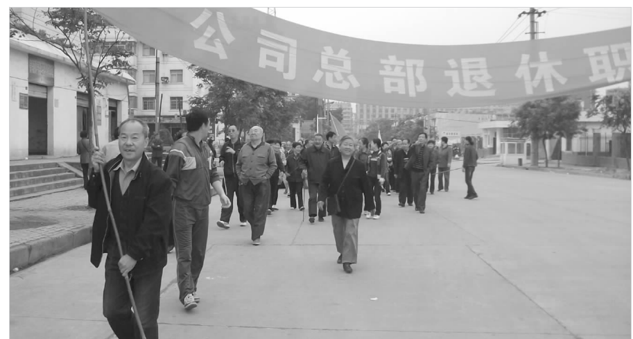
10月25日,公司退管办组织290名退休职工到梁山寺秋游,这是今年公司退管办为丰富退休职工的业余生活组织的第二次活动。

各试点单位特色活动层出不穷,首创了“讲故事、宣理念”、建立“1+1”内训师网络等宣贯方式,使职工的企业文化意识得到极大提高,主人翁精神得到明显增强,从而能够以更加积极的面貌投入工作。