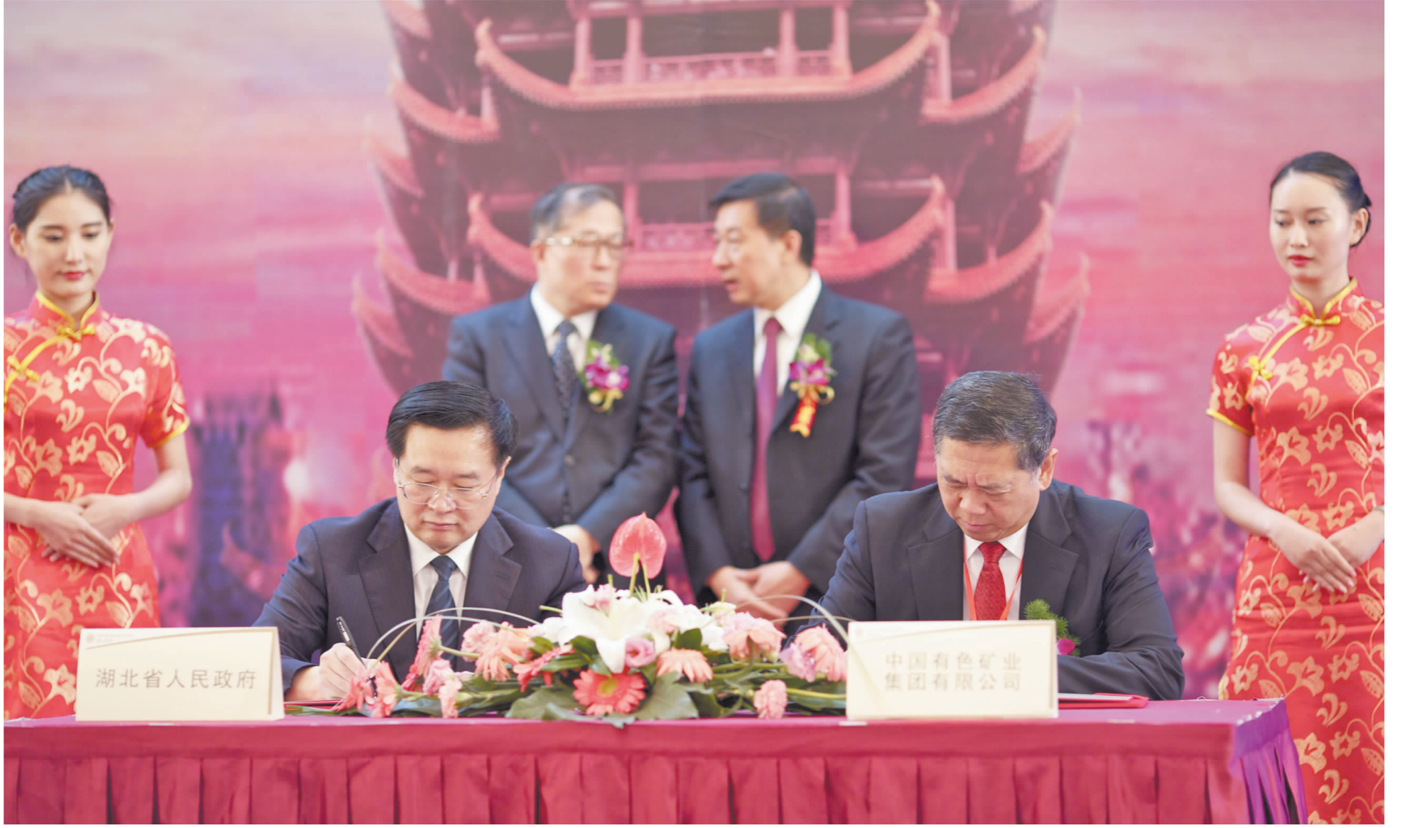
■ 9月19日,湖北省与央企深化合作会议上,中国有色集团总经理罗涛与湖北省省长王国生、在湖北省委书记李鸿忠和国务院国资委主任王勇的见证下,签订战略合作协议,共同推进大冶有色尽快实现千亿元企业目标