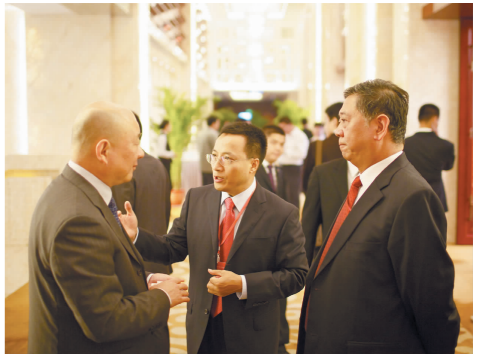
■ 湖北省副省长田承忠与罗涛、张麟在一起亲切交谈