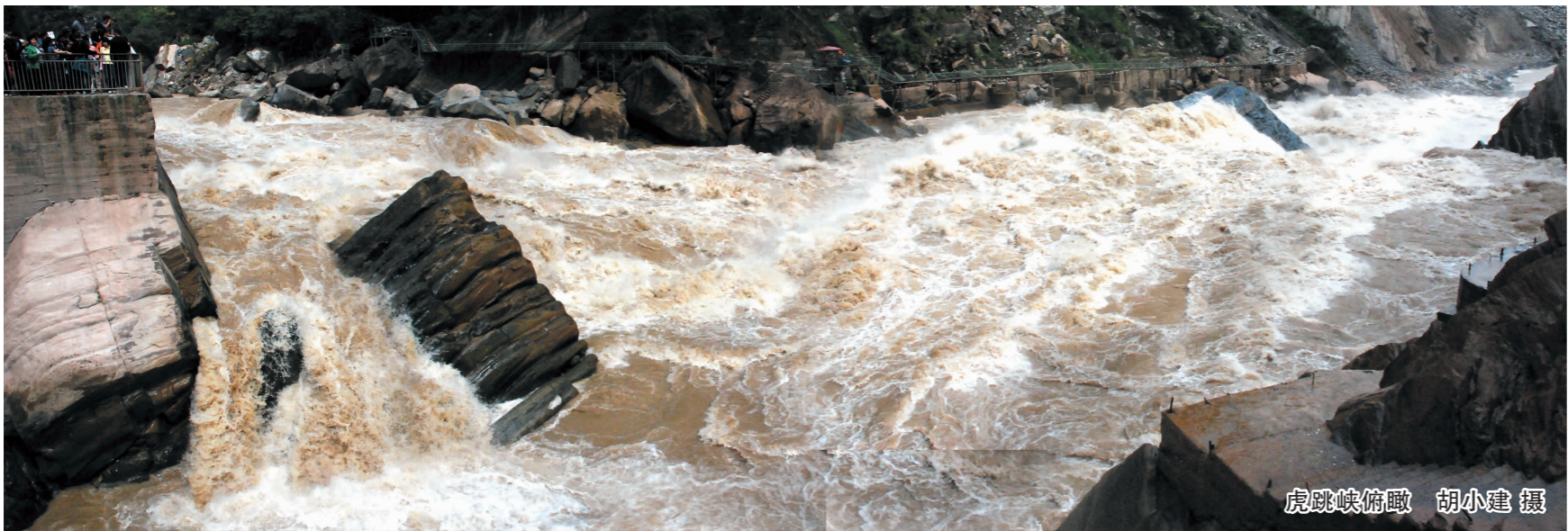
虎跳峡俯瞰