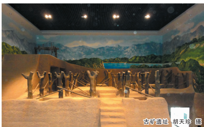
古矿遗址