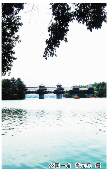
公园一角