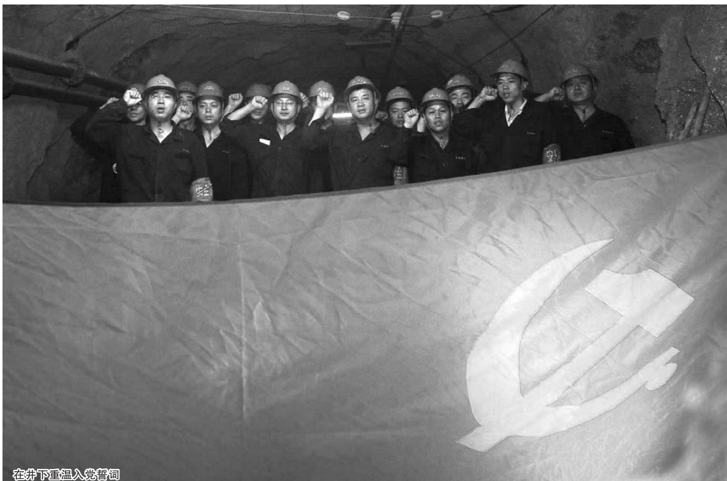
在井下重温入党誓词