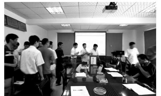
采掘车间开展的向困难职工捐款活动现场