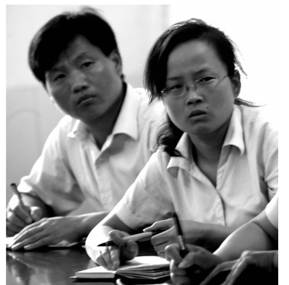
车间党员在“党员活动室”学习