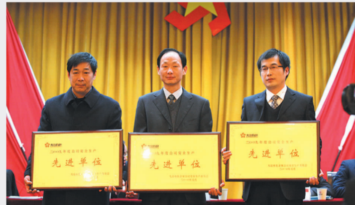
■ 冶炼厂、动力厂、丰山铜矿等2009年安全生产先进单位负责人上台领奖