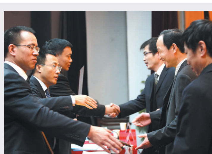
■ 公司领导为2009年安全生产先进单位颁奖