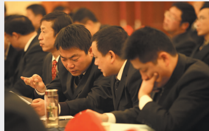
■ 与会代表认真领会讲话精神