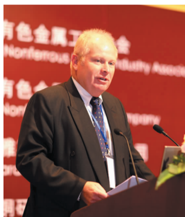
联合国国际铜研究组秘书长唐·斯梅尔讲话