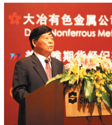
中国有色金属工业协会会长康义讲话