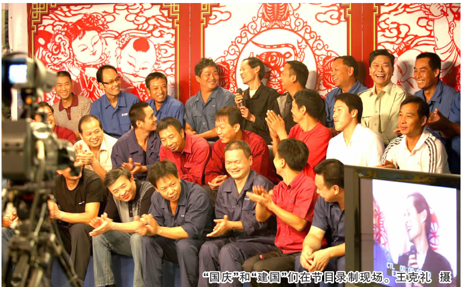
“国庆”和“建国”们在节目录制现场。

9月10日上午9时整,肆虐了多日的“秋老虎”也有了些软绵。黄石电视台演播厅来了一群特殊的客人,他们是公司各基层单位名字叫“国庆”或“建国”的职工,来这里参加黄石电视台纪念建国60周年《寻找“国庆”》专题活动。