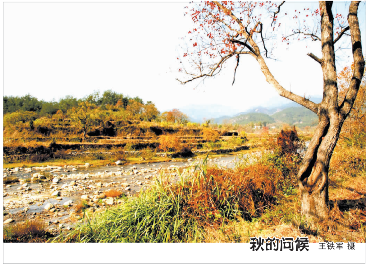
秋的问候