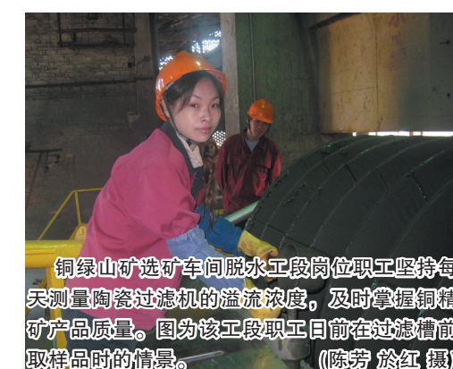
铜绿山矿选矿车间脱水工段岗位职工坚持每天测量陶瓷过滤机的溢流浓度,及时掌握铜精矿产品质量。图为该工段职工日前在过滤槽前取样时的情景。