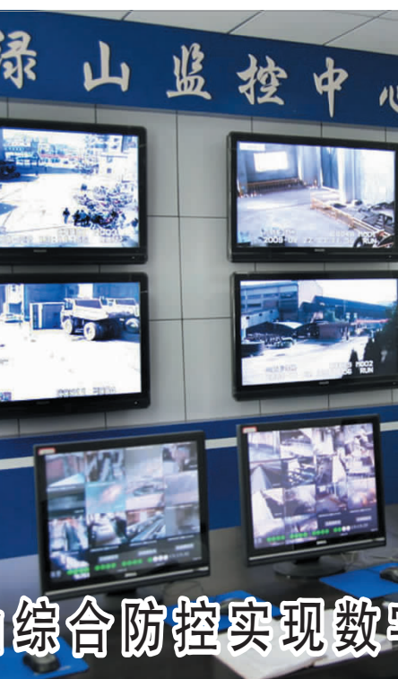
春节前夕,铜绿山矿投资100多万元新建的铜绿山矿监控中心在黄石市东方山公安分局石花派出所投入使用,在黄石、大冶地区率先实现矿区综合防控数字化,为构建和谐矿区、打造平安矿区提供了信息平台。图为石花派出所干警正在实时监视矿区治安情况。

徐自卫受贿案: 徐自卫在三友公司任职期间,利用职务上的便利,为他人谋利,收受他人贿赂,并造成国有资产流失。2008年10月9日,铁山区人民法院以受贿罪判处其有期徒刑一年缓刑一年。