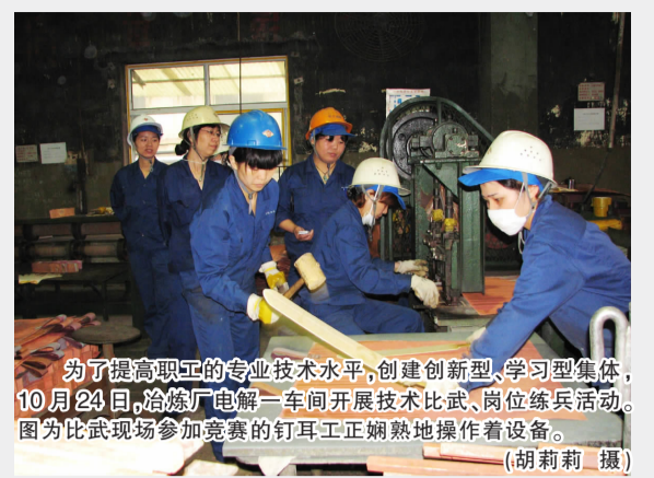
为了提高职工的专业技术水平,创建创新型学习型集体,10月24日,冶炼厂电解一车间开展技术比武、岗位练兵活动。图为比武现场参加竞赛的钉耳工正娴熟地操作着设备。

离开坑采车间后,坑采车间宣传橱窗上的一段话让我记忆犹新,就用这段话作为本文的结尾语:坑采人将在党的十七大精神指引下,深刻领会科学发展观在企业发展中的践行,团结、务实、创新,全面把坑采车间建设成一个“两型”和谐美好车间,矿山的明天一定会更美好!