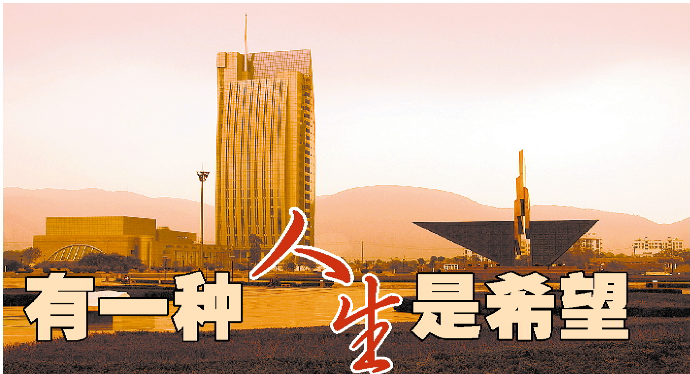
黄石人民广场