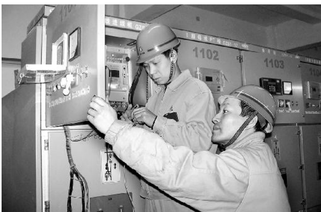
11月23日,氧化铝厂电气车间技术人员结合车间开展的“查隐患,保安全,反事故”劳动竞赛活动,对十一配东进线老化的综合保护装置进行了改造。

十一配主要为二、三管高压设备配电,为了彻底扭转设备运行不稳定状况,车间技术人员克服更改外部接线困难,在充分利用原有综合保护装置接线的基础上,完成了新综合保护装置的外部接线绘图,并对原综合保护装置进行了改造。