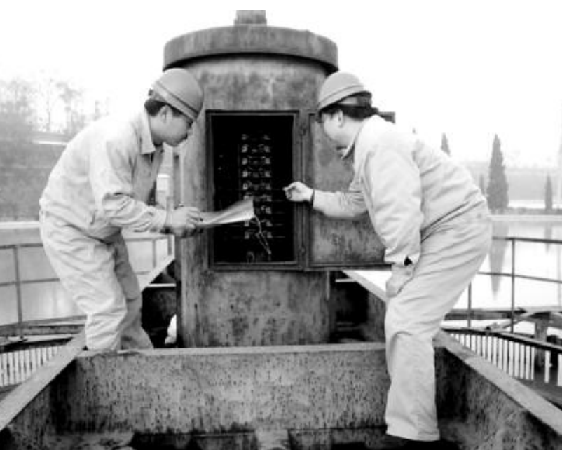
近日,水电厂黄河水源车间工会开展了“降耗降本,保安全供水”劳动竞赛活动,充分调动了员工的工作热情。

▲根据公司党委关于开展2009年中层管理者述廉议廉从价评价工作的通知精神,新长城实业党总支于11月23日下午召开了述廉议廉和廉洁从业评价专题会议。