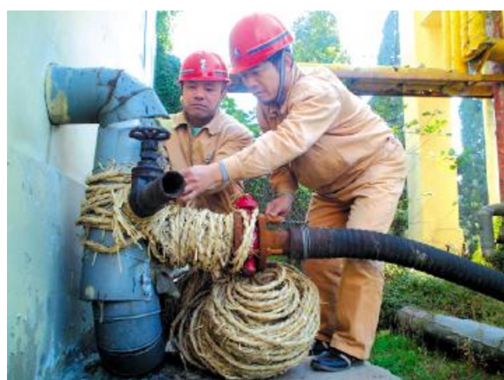
近日,水电厂黄河水源车间为保证两公司冬季安全用水,及早动手,积极采取防冻措施,为裸露在外的输水管道穿上了“过冬棉衣”。