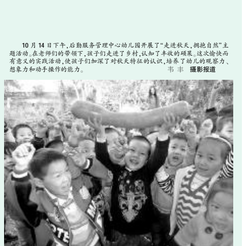
10月14日下午,后勤服务中心幼儿园开展了“走进秋天,拥抱自然”主题活动。在老师们的带领下,孩子们走进了乡村,认知了丰收的硕果。这次愉快而有意义的实践活动,使孩子们加深了对秋天特征的认识,培养了幼儿的观察力、想象力和动手操作的能力。