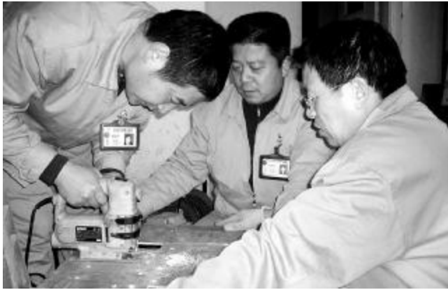
氧化铝二厂蒸发车间党支部组织党员、干部和职工骨干经过7天的紧张施工,圆满完成了氧化铝二厂4号熟料窑检修任务。图为检修现场,氧化铝二厂四车间4号熟料窑一直处于休眠状态,窑体内长达30米的耐火砖磨损严重,亟须更换。在检修过程中,由于主建车间施工人数紧张,该车间立即组织机关科室、项目部、检修站、汽车队等单位160余名党员、员工组成义务服务队,迅速在4号熟料窑检修现场开展了“我是党员我先上,关键时刻比贡献”的党员活动。正在大窑砌筑任务吃紧时,河南分公司企业文化部、装备部新闻部闻讯后,以最快的速度组成服务队立即到现场支援。他们一到现场,便同工程公司的参战党员、员工一道投入到紧张的运输工作之中。大家共同努力,把17000余块耐火砖从地面运到大窑内,保质保量地完成了砌筑任务。