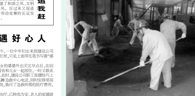
水电厂电气试验室党支部把“挖潜增效、党员奉献”活动与“三比一创”和创建“特色党支部”、“党员先锋岗”等特色活动结合起来,使学习实践科学发展观活动有机地融入到生产建设和经营管理之中。图为该车间党员为提绝缘手套打压试验的工作效率,利用废旧的绝缘板自行设计、自行改装了1套1次可打压10双手套的试验装置。使用,目前已成功投入使用,此项改造可节约成本2000多元。

最近时间以来,热电厂大力开展了厂容厂貌治理工作。通过开展专项治理、突击整治、集中整治等活动,一些卫生死角露出了新容,员工的工作环境得到了极大改善。图为该厂员工正在对场地填充料进行突击清理。