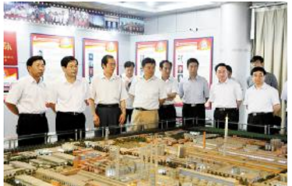
孙华山(左二)一行在河南分公司厂展室参观。

听完汇报后,国家安监总局二司司长杨富、省安监局党组书记王永新分别在会上对河南分公司今后的安全生产工作提出了要求和意见。孙华山对河南分公司多年来在安全生产方面所做的工作给予了充分肯定和高度评价。他要求河南分公司要时刻坚持全方位、全过程、全覆盖做好安全生产工作。他提出河南分公司要做好现代安全管理方法的研究和实践工作,把国外先进的安全生产理念中国化,积极地搞试点工作,使先进的安全生产管理方法尽快适应本企业、本企业的安全生产管理工作。他还希望河南分公司要抓住此次国家安全生产标准化一级企业审核验收的