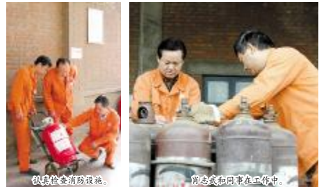
认真检查消防设施。