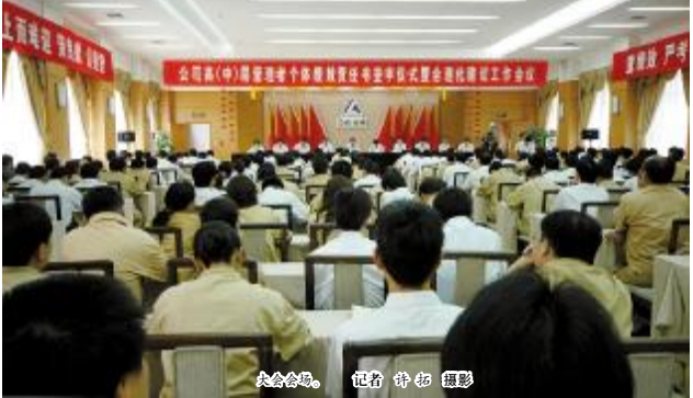
大会会场。

我们一定要两眼向内，苦练内功。各单位要对标先进单位，认真查找差距和不足，采取积极措施，认真落实降本增效，只有这样才能打赢生死存亡保卫战，才能打赢降本增效攻坚战。