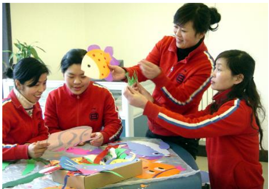
后勤服务管理中心幼儿园教师为配合“示范园”验收工作,本着节约资金的原则,自己动手制作教学工具,用爱心为孩子们营造了一个快乐健康的家园。图为正在制作教学工具的教师们。 屈波 摄影报道

▲3月5日,运输部车务段党支部组织全体党员召开了“企业有困难,我是党员我奉献”活动动员大会,58名党员在倡议书上庄严签字。(傅晓阳) ▲3月14日,来自电解厂的一百多名员工参加了在长城铝技校组织的钳工、电工、焊工技能鉴定考核。(杜立新) ▲3月10日,水电厂污水处理车间工会对报考“首席员工”的人员进行了考试选拔和申报。(杨丽红) ▲3月9日,运输部机务段组织员工对运输部院内畅通路、平安路两条主干道两侧的37个下水道进行了义务清理,为确保汛期排水畅通奠定了基础。(欧阳建设 李亚荣)