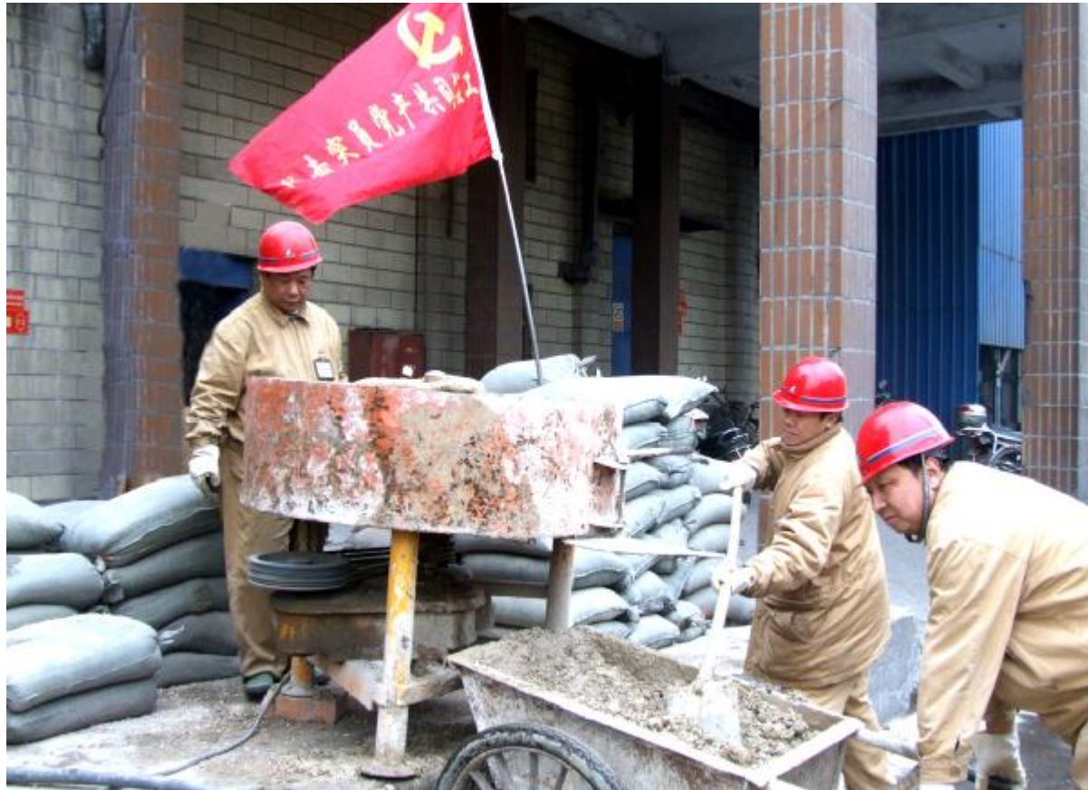
3月6日,工程公司党委组织广大党员、员工在氧化铝厂3号熟料窑大修现场开展了“党员突击队”、“党员示范岗”为内容的系列党建活动。施工期间,广大党员干在前,抢在先,充分发挥了模范带头作用,从而确保了大修工程一次试车成功。图为该公司党员在现场搅拌、运送大窑浇注料的场面。