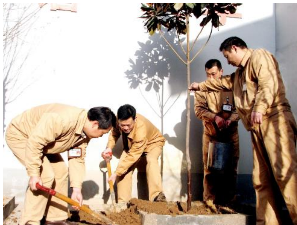
3月9日，氧化铝一厂空压站党支部组织党员义务植树。部分党员植树后在党员承诺书上郑重地写下了承诺：尽全力确保树木成活。图为党员在植树。