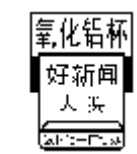
氧化铝杯好新闻大奖