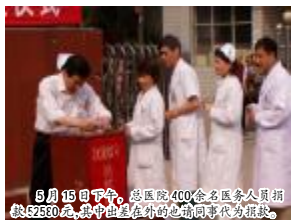
5月15日下午,总医院400余名医务人员捐款52530元,其中由正在值班的护理人员代为捐款。