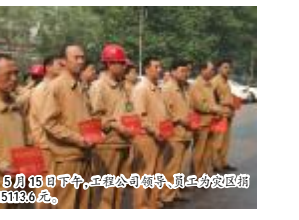
5月15日下午,工程公司领导、员工为灾区捐款45113.6元。