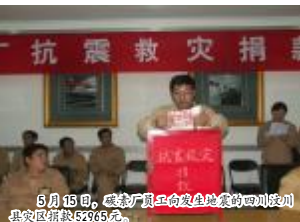
5月15日,磁选厂员工向发生地震的四川汶川灾区捐款5245元。