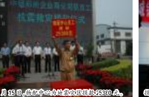
5月15日,物流中心为地震灾区捐款25880元。