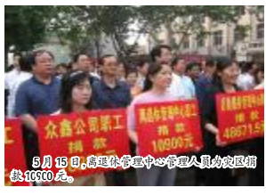
5月15日,物流管理中心管理人员为灾区捐款10900元。