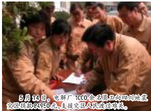
5月14日,电解厂1000余名员工向四川地震灾区捐款93950元,支援灾区人民抗震救灾。