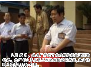
5月15日,热电厂举行了向四川地震灾区捐款仪式,全厂800多名员工踊跃捐款,共筹集到人民币58840元。