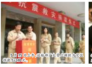
5月15日上午,运输部员工踊跃为灾区捐款52240元。