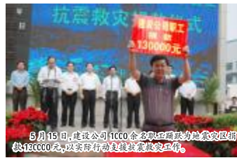
5月15日,建设公司1100余名职工踊跃为地震灾区捐款130000元,以实际行动支援抗震救灾工作。