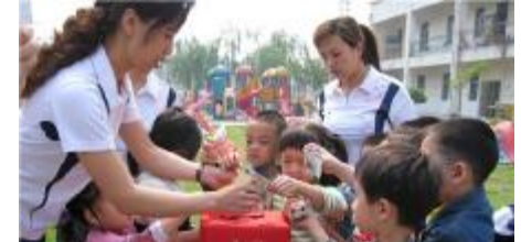
5月15日上午,后勤服务管理中心600余名员工慷慨解囊,幼儿园的小朋友也伸出稚嫩的小手,奉献一份爱心,在很短的时间里,广大员工自发地为灾区人民捐款48719元(含幼儿自发捐款3719元)。