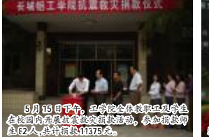
5月15日下午,工学院全体教职员工和学生在校内开展抗震救灾捐款活动,参加捐款师生62人,共捐款11375元。