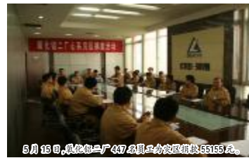
5月15日,氧化铝二厂477名员工的抗震捐款55155元。