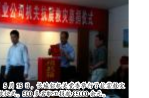
5月15日,氧化铝厂工会举行了抗震救灾捐款仪式,500多名职工捐款60000余元。