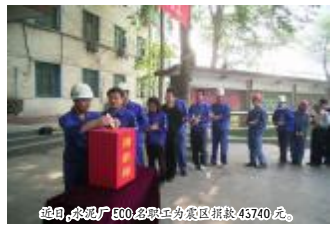
近日,水泥厂500名员工为灾区捐款43740元。