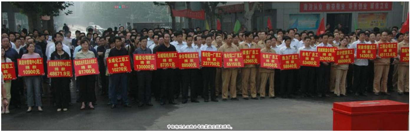
中铝郑州企业向灾区抗震救灾捐款现场。

与灾区人民心连心。在中铝郑州企业领导的统一部署下,中铝郑州企业广大职工(员)踊跃捐款。他们把自己的一份份爱心奉献给灾区人民,为灾区人民抗震救灾献上了一份绵薄之力。