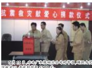
5月15日,氧化铝厂机修公司的号召,踊跃为灾区献爱心,共收到捐款53450元。