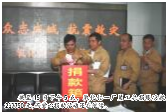
截至15日下午5点,氧化铝一厂员工共捐赠抗震237150元,各项捐助活动还在继续。