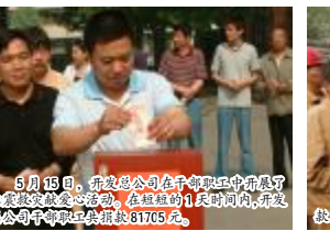
5月15日,开发总公司在干部职工中开展了抗震救灾献爱心活动,在很短的1天时间内,开发总公司干部职工共捐款81705元。