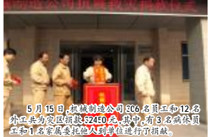
5月15日,机械制造公司500名员工和12名外工共为灾区捐款52450元,其中有3名退休员工和1名家属委托代理人到单位进行了捐款。