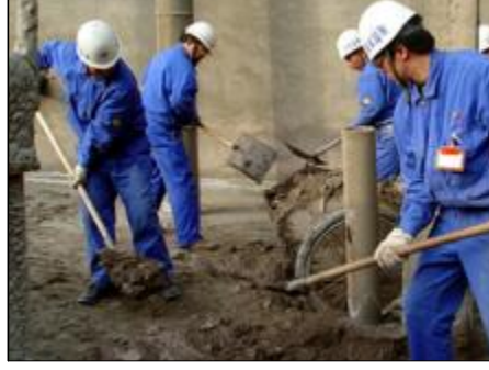
为了美化环境，给职工创造一个安全、稳定、和谐的氛围。2月28日，水电厂党委组织部共组织共二十余人，到原料车间料浆池生产现场进行突击义务劳动。经过3个多小时的奋战，共清扫垃圾、杂物三吨多，保证了原料车间生产的正常运行。

中国铝业股份有限公司河南分公司女工特殊权益保护专项集体合同 第十七条 女工响应政策号召，并晚婚(指初次结婚)的，除享受国家规定的3天婚假外，增加婚假18天。 第十八条 女工在怀孕期间，所在单位不得安排其从事国家规定的第三级体力劳动强度的劳动和孕期禁忌从事的劳动，不得在正常劳动以外延长劳动时间；对不能胜任原劳动的，应当根据医务部门的证明，予以减轻劳动量或者安排其他劳动。 怀孕的女工，在劳动时间内进行产前检查，应当算做劳动时间。 第十九条 禁止安排已婚未育的女工和怀孕期、哺乳期的女工从事接触铅、汞、镭、二硫化碳等超过国家卫生标准的有毒有害物质和超过国家卫生标准的有害剂量当量限值的放射线作业。 从事接触铅、镉、砷、磷及其化合物作业和辐射超标(包括超声波、电磁波等)的女工，在其怀孕期、哺乳期，应调离岗位，安排其他工作。 第二十条 符合计划生育政策妊娠的女工怀孕不满4个月流产时，给予产假30天；怀孕满4个月以上流产时，给予产假42天。满7个月分娩，按正常产假对待。产假期间工资照常发 放(保健、误餐费扣除)，绩效工资按本单位平均工资发放。 第二十一条 对怀孕7个月以上(含7个月)的女工，不得安排其延长工作时间和夜班劳动，应给予每天工作间休息1小时，并相应减少其劳动定额。如工作许可，经本人申请，公司批准，可请产前假两个月。 第二十二条 政策内生育的女工产假为90天；难产的，增加产假15天；多胞胎生育的，每多生育1个婴儿，增加产假15天。达到晚育年龄且初育的女工，除享受国家规定的产假外，按照《河南省计划生育条例》的规定，增加产假3个月，给予其配偶护理假1个月，女工可在产前15天开始休产假，休假期数计算在产假天数之内。 女工产假期满，可以申请请哺乳假。经批准办理手续后执行，休工期为1至2年，享受产假期间待遇。其期间工资按在岗一档，发放责任工资的50%。停发绩效工资；产假期间，因身体原因不能工作，且未办理休工手续的，其超过产假期间的待遇，按照病假处理。 第二十三条 在公司加入医疗保险的女工，其产假期间由生育保险基金支付医疗费用，生育保险基金支付医疗费用，生育保险基金支付医疗费用。