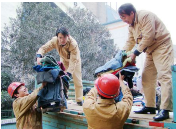
浓浓爱心暖寒冬,件件衣物传真情。日前,热力厂员工在“送温暖、献爱心”活动中踊跃捐款捐物。此次活动共收到现金1200余元,棉衣、棉裤等衣物1000多件。因为该厂员工正在清点、整理所捐衣物,装车,运往灾区。

该公司“大员工”从电视新闻、报纸媒体上看到灾区人民过冬十分困难的新闻后,十分关心灾区人民的安全过冬问题,并把这次捐款捐物活动与宣传党的十七大精神结合起来,发扬“一方有难,八方支援”的传统美德,并以最短的时间捐款捐物、棉衣和现金。这些所捐物资已全部通过当地民政局“送往灾区困难群众手中,充分体现了员工阶级为构建和谐会所作出的贡献。