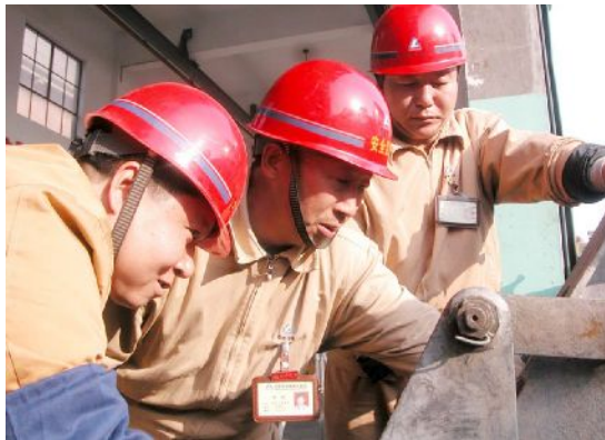
今年年初以来,电解厂运输车间阳极更换车班通过开展业务学习和“两学两创”活动,提高了班组管理水平和员工综合素质。图为该班员工正在改造阳极更换车设备。

和谐稳定聚人心。供电车间党支部按照“四好”班子标准,在“党员开展”“三比一创”和“特色党支部、党员先锋岗”创建活动中,结合生产实际,细化检修、运行操作规程,制订出符合车间实际的“三五工作法”,突出了“特色”,争得了典型。