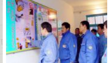
水泥厂检修车间制作的安全生产文化长廊内容丰富、图文并茂,吸引了职工们驻足观看,起到很好的安全警示教育作用。