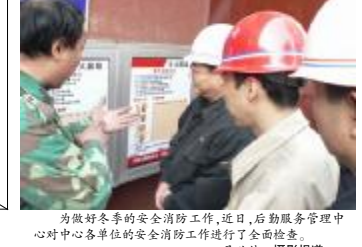
为做好冬季的安全消防工作,近日,后勤服务管理中心对中心各单位的安全消防工作进行了全面检查。