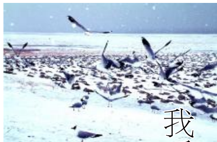
北方冬天才有雪。我生长在北方,是北方的雪伴我成长,我爱北方的雪。