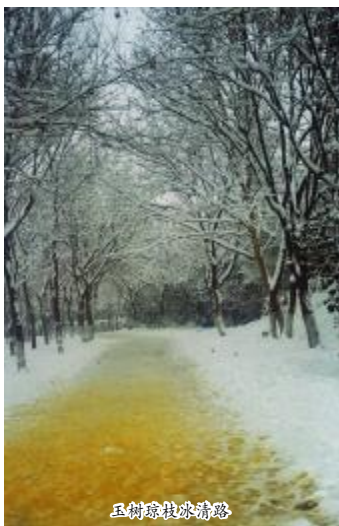
玉树琼枝冰清玉洁

作为全托班的保育老师,不仅要关心孩子们的起居,更重要的是要主动走进孩子们的心灵,让他们相信你,依靠你。这样,我会无愧地告诉孩子们:“这儿就是你们的家。”