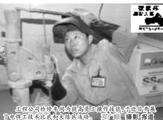
工程检修车间为提升员工操作技能,于近日开展守电焊工技术比武和大练兵活动。