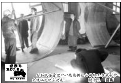
后勤服务管理中心热能供应公司联合分厂大修期间，对分厂配套设施进行检修。

本报讯(通讯员 马义林)为保证今年冬季供暖工作的顺利进行,近日,后勤服务管理中心召开了主任办公会,对冬季供暖工作进行了全面的部署和安排。目前,生活区供暖准备工作已经全部到位,供暖管道试压正在有条不紊地进行。