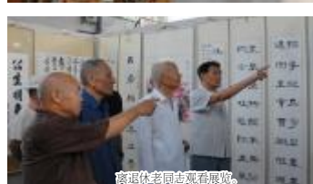
离退休老同志观看展览。