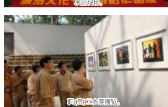
职工(员工)参观展览。