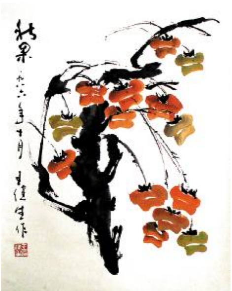
国画 作者 王健生