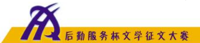
后勤服务杯文学征文大赛

郁郁葱葱是生命的家园。 回望历史把握现在， 为了未来我们鼓满风帆。 面对庄严的党旗， 我坚定着心中的信仰。 岗位上的汗水， 灌溉着心中崇高的理想。 泥土的馨香摇曳着激情， 熟悉的歌声洋溢着向往。 坚定的足迹是律动的音符， 平凡的日月承载着美好的希望。 仰望党旗， 聆听中华民族五千年的理想。 乘着时代的长风， 我们走向胜利走向辉煌。